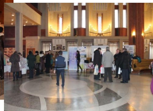
Standuri expoziționale cu materiale de